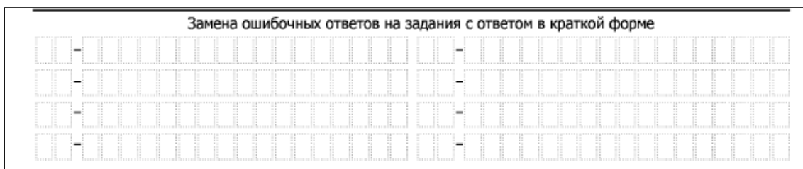
Рис.3. Область замены ошибочных ответов на задания с кратким ответом

В случае, если КИМ не предусматривает записи ответа на бланке №1, поле для записи ответа заполнено символами «XXX».